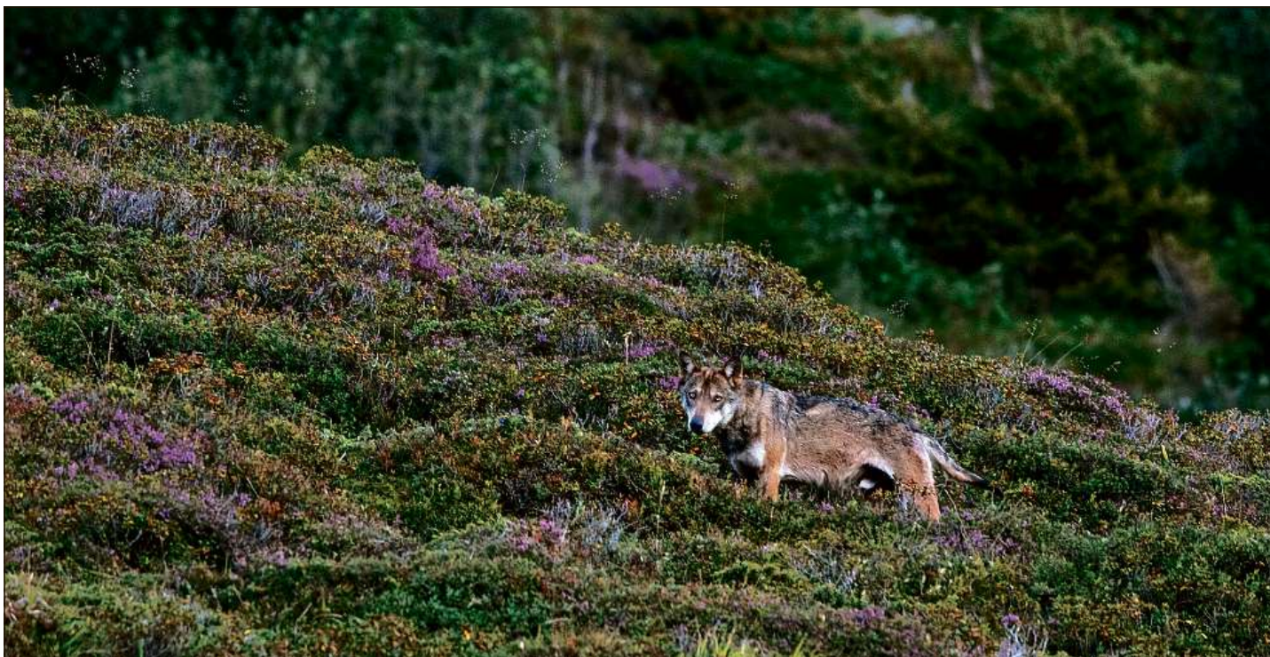
Gia igl onn 2006 eis ei reussiu a Peter A. Dettling da fotografar in luf en Surselva.

Il cudisch «Wolfsodysee» da Peter A. Dettling ei cumpariu