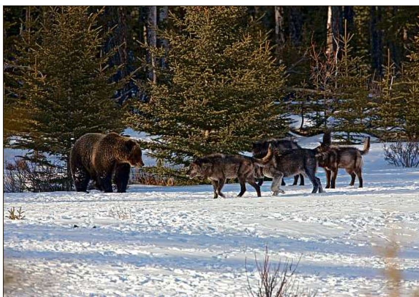
La scuntrada digl uors culs lufs – fotografada da Peter A. Dettling.

■ Il cudisch «Wolfsodysee» ei aschidadir il resultat dalla lavur da perscrutaziun, foto e film ch'il Tuatschin Peter A. Dettling ha fatg ils davos 16 onns. El ralata da si'emprema scuntrada cun lufs, dalla historia dil luf en Surselva e dalla veta dil triep da lufs al Calanda, mo era d'auters el Canada. Igl ei in'interessanta publicaziun, adattada per in e scadin che vul saver dapli davart il luf. «Wolfsodysee – in viadi el reginavel tschelau dils lufs». In meglier tetel haveis Peter A. Dettling buca saviu catar per siu cudisch davart il luf. L'ovra cumparida quels dis ella Casa editura Werd & Weber SA a Thun/Gwatt respnda numnamein la fascinaziun digl autur per quei animal da rapina grond, mo era si'enorma perseveronza da perseguitar el. Tgi ch'ei magari ella natira e persequitescha la fauna sa che veser igl animal preferiu pretenda pazienza e meinsvart era bia direzia, surtut ils muments che l'aura ei buca sco en stiva. Quei ha Dettling ch'ei carschiu si a Sedrun e ch'ha anflau siu secund dacasa el Canada fatg sur biars onns. En quei temps eis el era daventaus pertscharts dils conflicts denter carstgaun e luf, surtut leu nua ch'il luf ei sederasaus suenter esser vegnius diabolisau ed extirpau pli baul. Aschia en Svizra, el Grischun ed en special era en Surselva. Ins sa esser pro ni contra luf – mo ins duess enconuscher la natira digl animal avon che giudicar el cun pregiudezis. Quella via ei il fotograf, filmader e scribent tuatschin ius cun tutta consequenza.