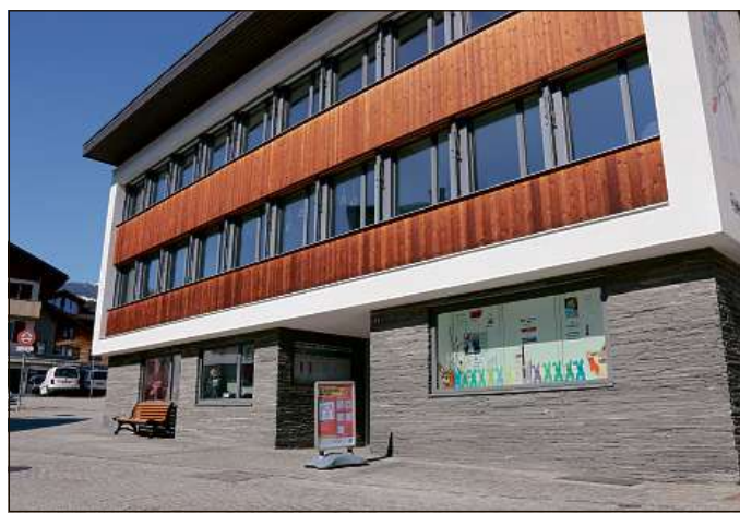
La situaziun malguessa dil mument cul coronavirus pretenda sentiment dallas vischnauncas.